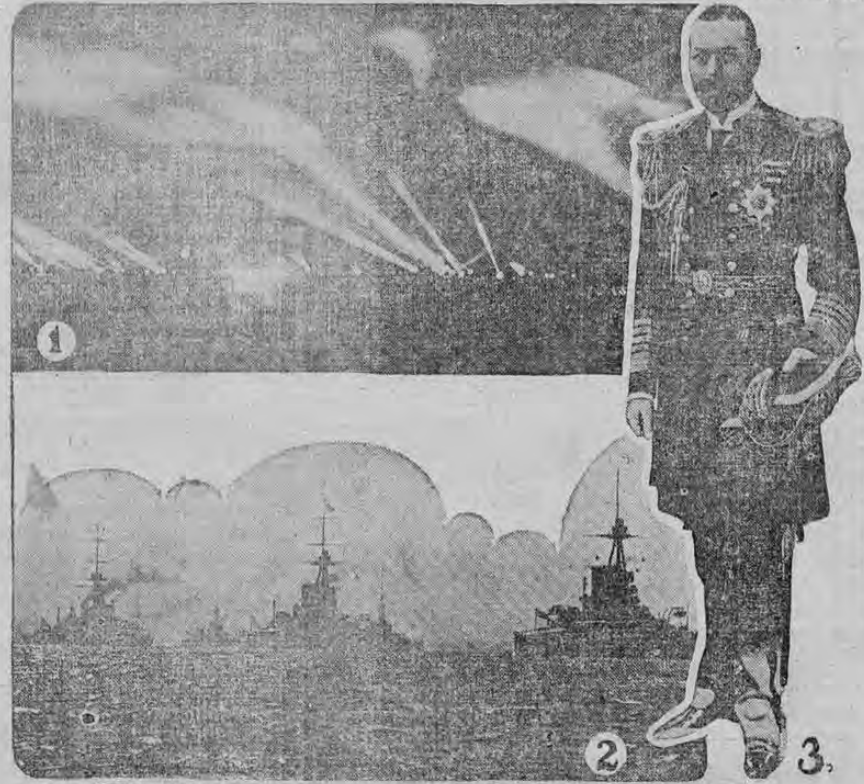
1-SEARCHLIGHT DISPLAY FROM BRITISH BATTLESHIPS 2-ENGLISH WARSHIPS IN LINE. 3-KING GEORGE OF ENGLAND

Inglaterra posee la flota de guerra más grande del mundo. Su primer paso para protegerse contra la invasión alemana fue mandar su primera escuadra compuesta de 29 acorazados, 4 cruceros de combate y 13 cruceros blindados al Mar del Norte. Después de esto movilizó su "home fleet" que fue revista en Portland por el Rey. En esta revista tomaron parte 425 buques de guerra de toda clase. El grabado representa parte de la escuadra haciendo uso de sus potentes focos.